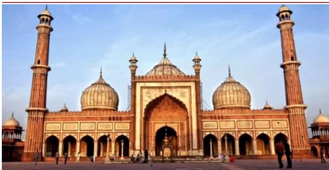
Esterno Jama Masjid

GIORNO Prima colazione in hotel e trasferimento ad Udaipur . Nel tragitto sosta per visitare Om Banna Shrine , tempio dedicato ad una moto. Successivamente visita dei Templi Jainisti di Ranakpur del XV secolo, capolavoro d'intarsio nel marmo bianco. Arrivo in hotel per la cena e il pernottamento.