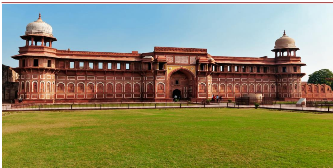
Particolare Agra For

GIORNO Prima colazione in hotel. Trasferimento all'aeroporto e partenza per Roma Fiumicino con volo Air India. Arrivo in serata.