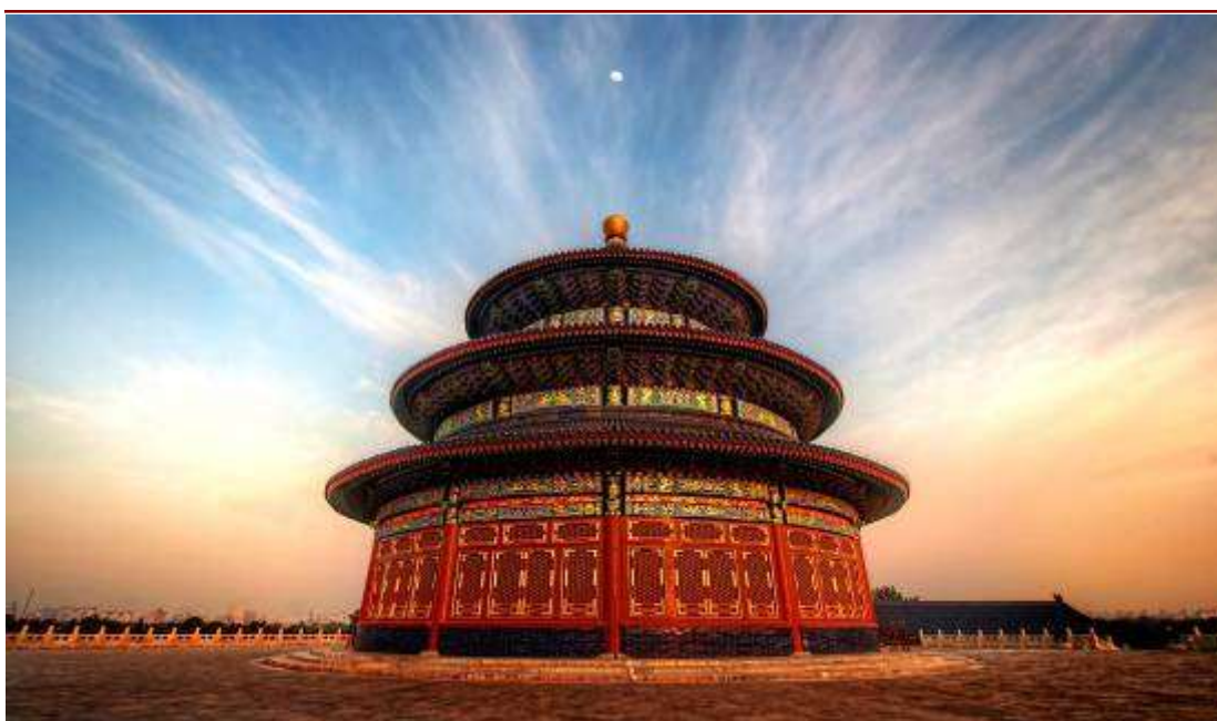
Esterno Tempio del Cielo

Prima colazione in hotel. Questa mattina visita al simbolo della Cina, la Grande Muraglia , nota come il progetto difensivo più lungo al mondo , circa 6.300 Km, costruita per difendersi dai mongoli più di 2.000 anni fa. Pranzo in un ristorante locale. Nel pomeriggio proseguimento della visita alla Via Sacra . Rientro in hotel per la cena ed il pernottamento.