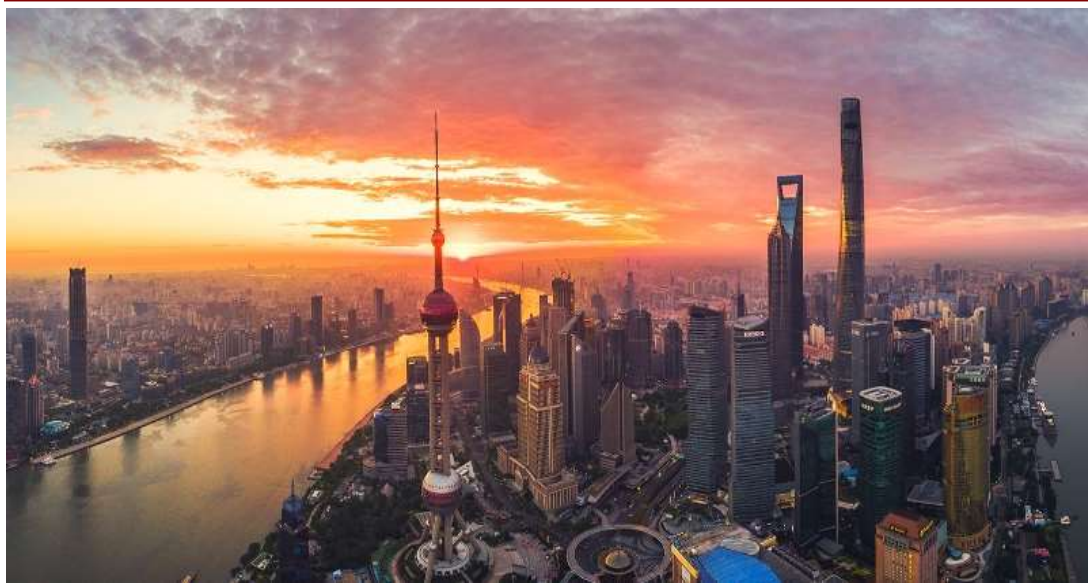
Particolare di Shanghai

Prima colazione in hotel. Trasferimento all'aeroporto e partenza per Roma Fiumicino. Arrivo in serata.